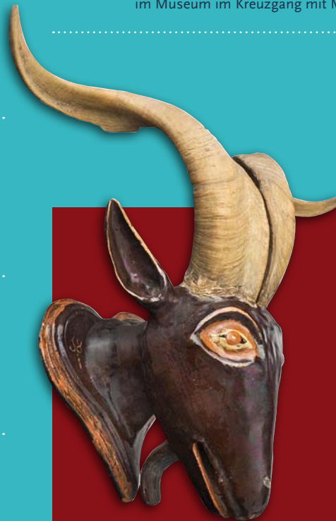
Widderkopf mit natürlichem Gehörn (Kröning 1863)

Führung durch die Ausstellung „90+ Landshut seit 1918“ im Museum im Kreuzgang mit Max Tewes M. A.